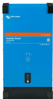
Inversor Smart 12/3000